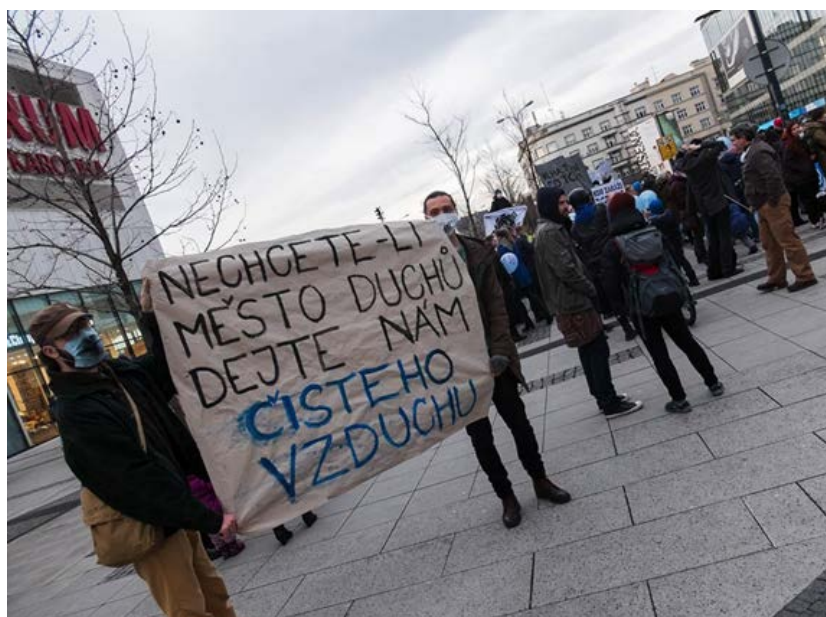
Názory účastníků happeningu