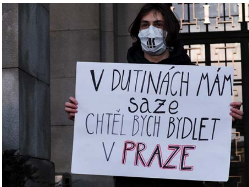
Účastník demonstrace před Novou Radnicí