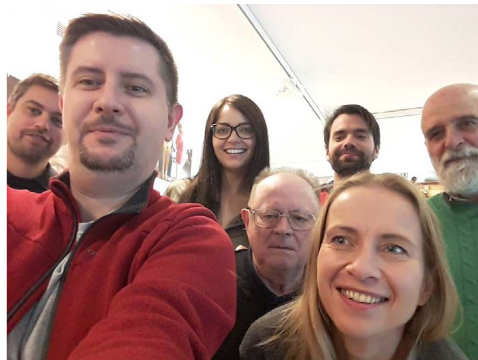
Partneři projektu Visegrad manifesto on air quality

http://www.cistenebe.cz/aktuality/fejjetony/472-konference-visegrad-manifesto-on-air-quality