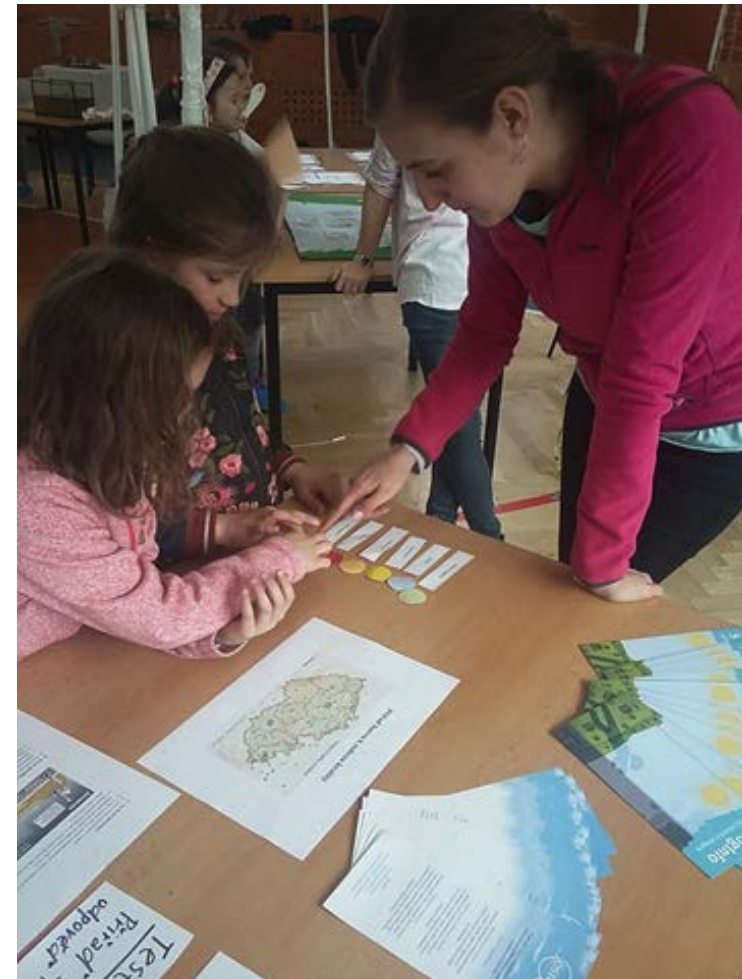
Dobrovolnice Čistého nebe s dětmi