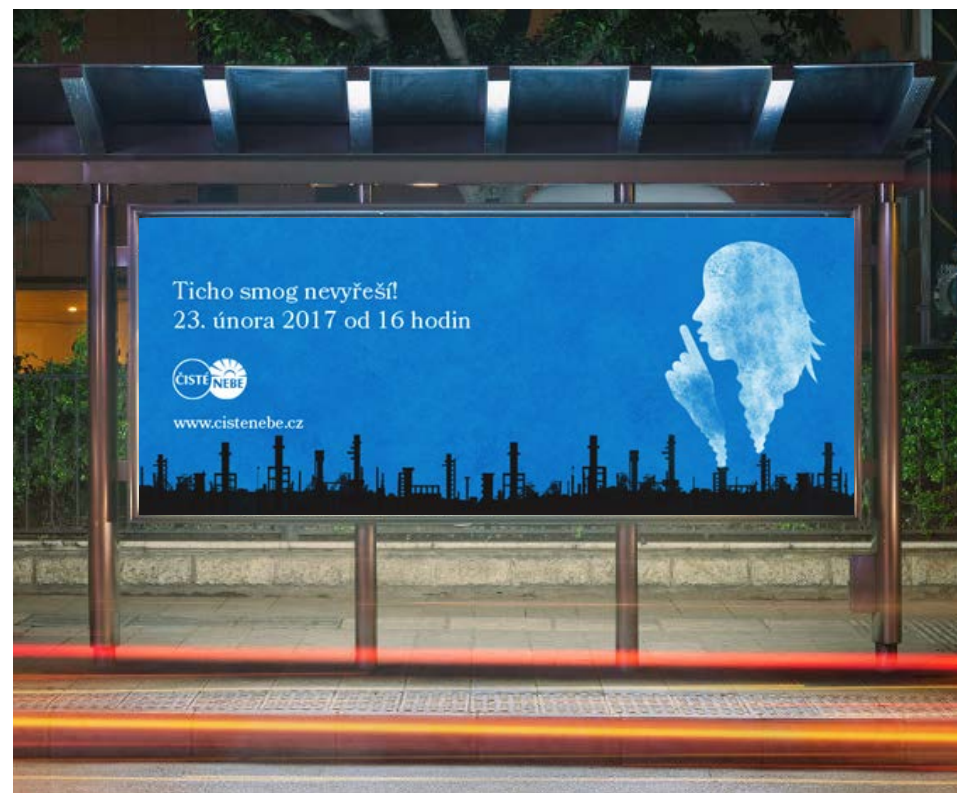
Banner k události