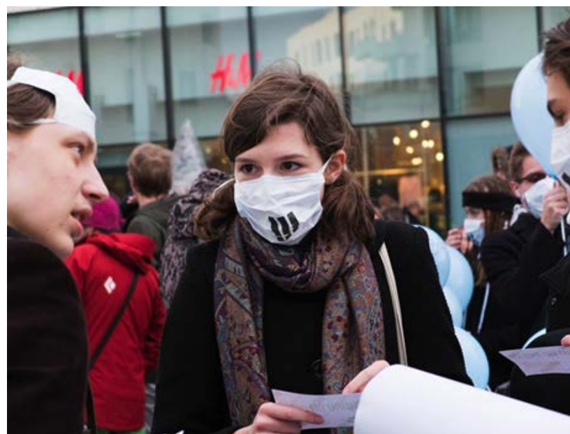
Účastníci happeningu